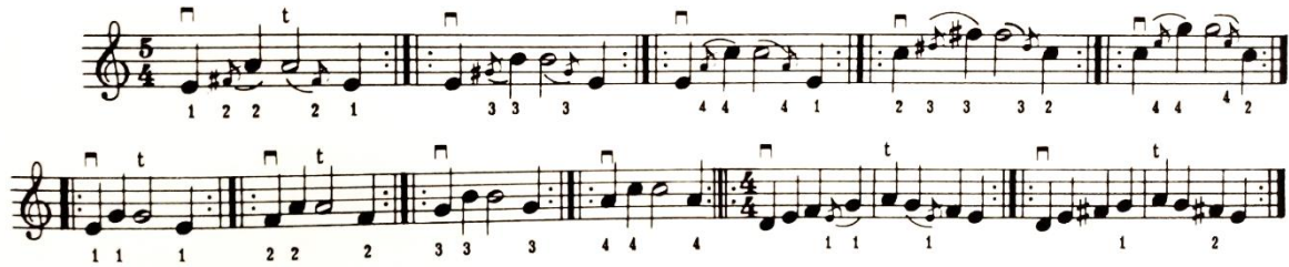
شكل رقم (٢١)

التمرين التالى يوضح ما يقصده صامويل ألبيوم كما فى الشكل رقم (٢١):