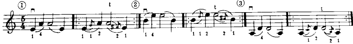
شكل رقم (١٦)

وينصح سامويل ألبليوم بإستخدام الإنتقال بالأصبع الأول إلى الإصبع الثاني فى الوضع الثالث من خلال التمرين التالى (شكل رقم ١٦):