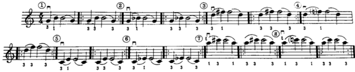
شكل رقم (١٤)

المثال الثالث: الإنتقال بالإصبع الثالث من والى الوضع الثالث ، كما موضح فى الشكل رقم (١٤):