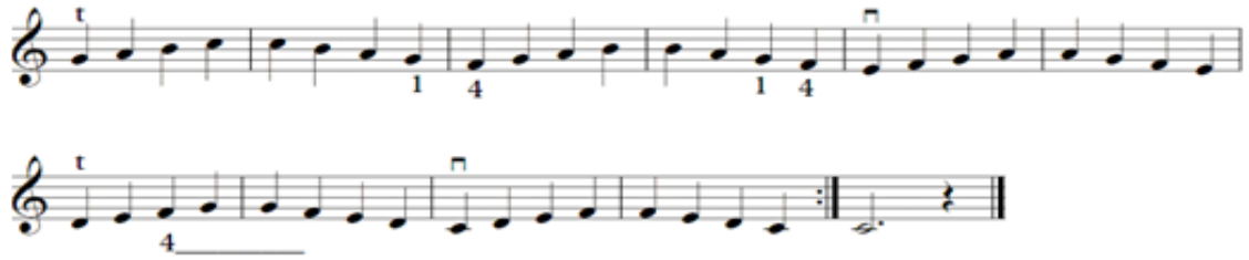
الشكل رقم (٦)

* وينصح سامويل ألبليوم أن يكون الإنتقال من وتر لآخر على وترى لا ومى كما هو موضح فى الشكل رقم (٧).