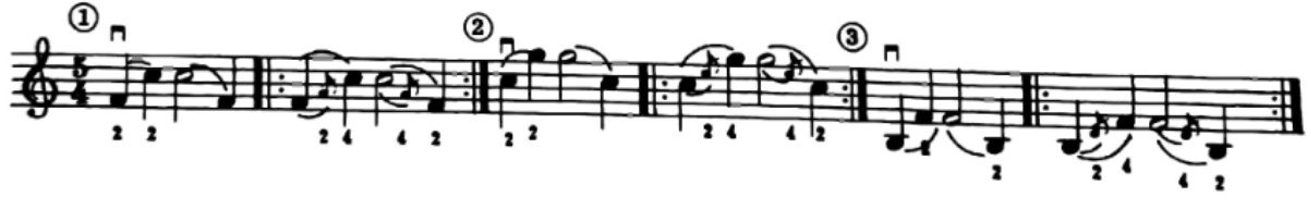
شكل رقم (٢٠)

وللتدريب على الانتقال بالإصبع الثانى الى الإصبع الرابع فى الوضع الثالث ينصح صامويل ألبيوم بالتمرين التالى (شكل رقم ٢٠):