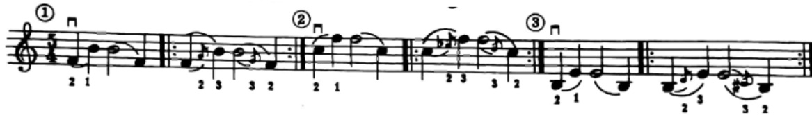
شكل رقم (١٩)

وللتدريب على الإنتقال بالإصبع الثانى الى الإصبع الثالث فى الوضع الثالث ينصح سامويل ألبليوم بالتمرين التالى (شكل رقم ١٩):