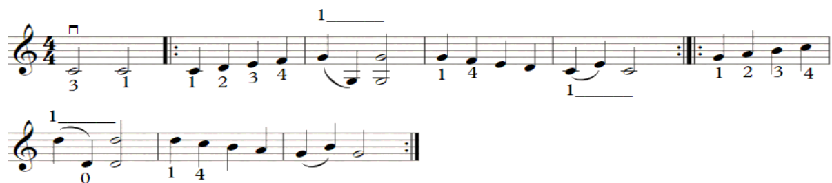
الشكل رقم (٥)

ويقترح سامويل ألبليوم أن يكون الإنتقال من وتر لآخر فى الوضع الثالث العزفى كالتالى فى الشكل رقم (٥):