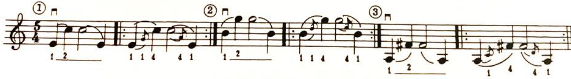
شكل رقم (١٨)

وينصح سامويل ألبليوم بإستخدام الإنتقال بالإصبع الأول الى الإصبع الرابع فى الوضع الثالث عن طريق التمرين التالى (شكل رقم ١٨) :