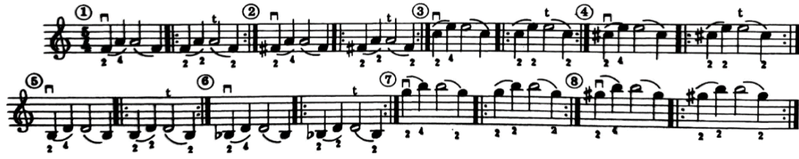
شكل رقم (١٣)

المثال الثاني: الإنتقال بالإصبع الثاني من والى الوضع الثالث، كما موضح فى الشكل رقم (١٣):