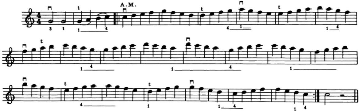
الشكل رقم (٨)

٤- وتطبيقا لما سبق ينصح سامويل ألبليوم بأداء هذه المقطوعة لما تحتويه أرقام الأصابع التى تساعد على الإنتقال من وإلى الوضع الثالث كما موضح فى الشكل رقم (٩):